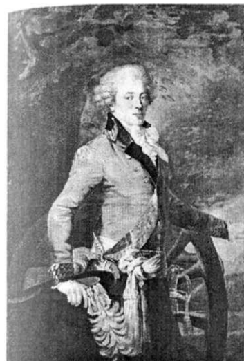
Генерал артылерыі Станіслаў Костка Патоцкі(1755-1821)