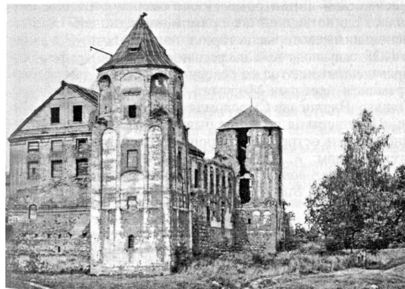
Усходні фасад замка(фота 1970-х гг.)

1а-1б. Схемы размяшчэння войскаў напачатку і ў канцы бітвы (з рапарта Юзафа Юдыцкага каралю Станіславу Аўгусту)