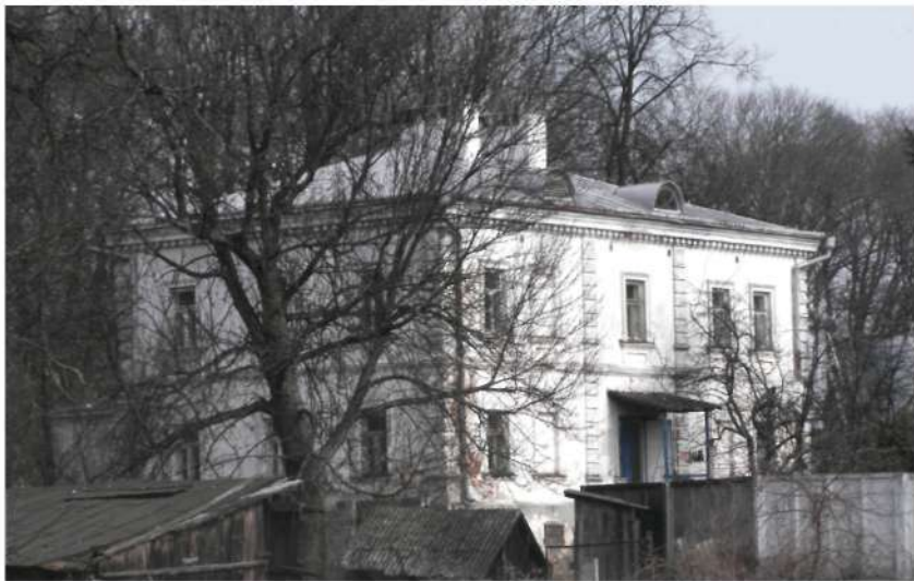
Илл. 3 Офисина

селится в фольварочном флигеле и, зная цену исторического замка, несмотря на предстоящие трудности, взялся за его восстановление. Основными источниками дохода становятся хорошо устроенный фольварк, в котором работали спиртзавод (выпуск ректификата), лесопилка, механические мастерские, кирпичный завод; имелись птицеферма (выращивалась домашняя птица, редкие породы кур), ферма черно-бурых лисиц.