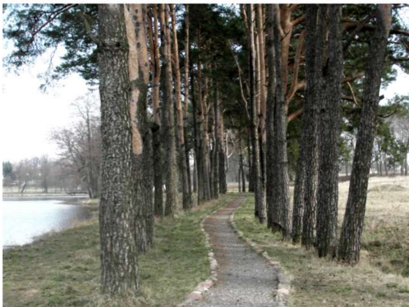
Илл.2. Аллея сосны обыкновенной