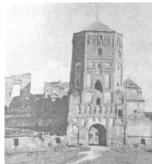
Мирский замок. Центральная башня.  1952. Планишет-обмер. 1953.