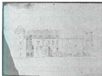
Мирский замок. Восточный фасад. Планишет-обмер. 1953.