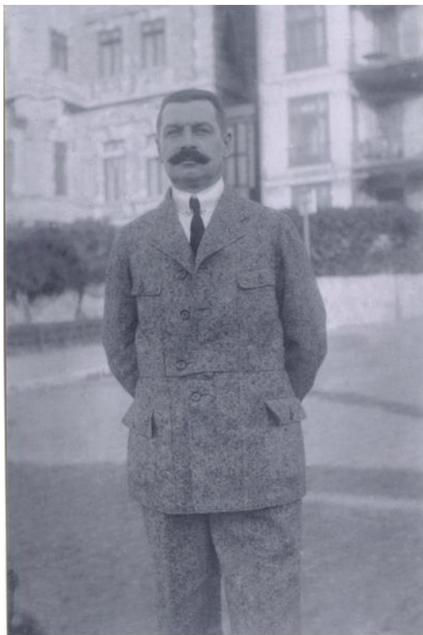
Иван Николаевич Святополк-Мирский. Фото 190-е гг.