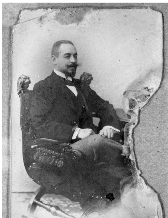
Князь Михаил Николаевич Святополк-Мирский. С.-Петербург. Фото 1890-е гг.