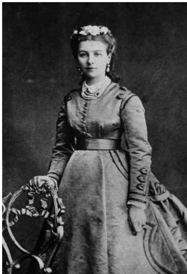
Княгиня Клеопатра Михайловна Святополк-Мирская Урожденная Ханыкова. Фото 1870-е гг.