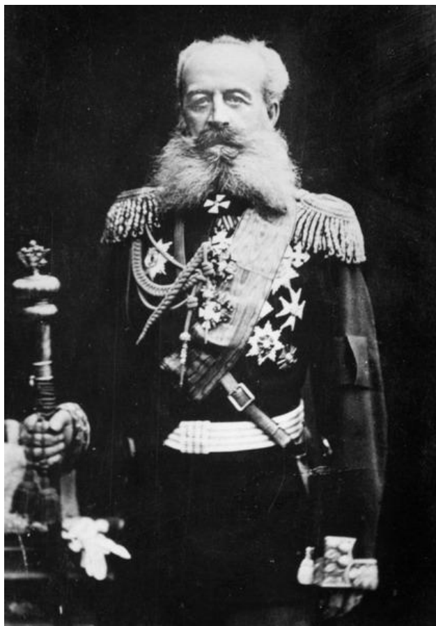
Князь Николай Иванович Святополк-Мирский. Фото конца XIX ст.