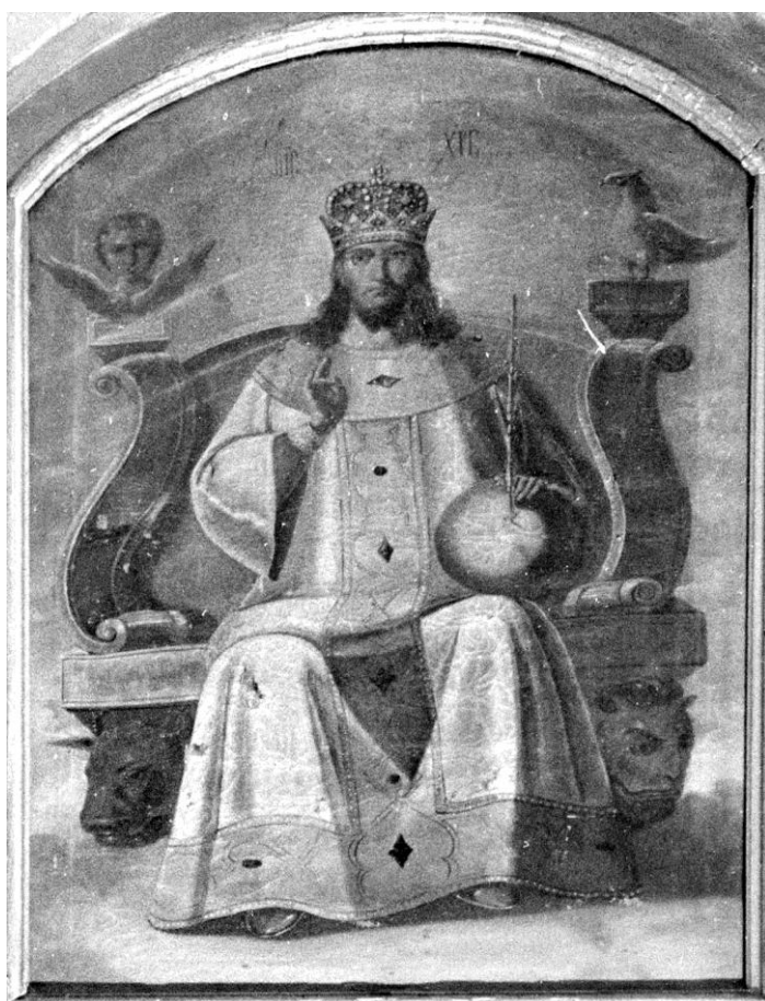
(Рис.6) Спас Великий Архирей. Конец XIX-начало XX в.