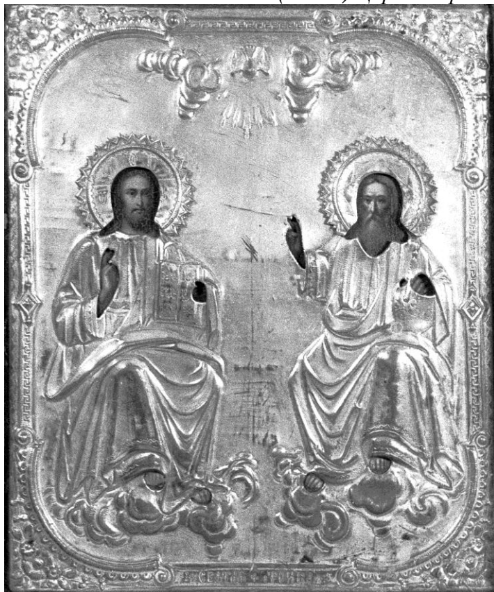
(Рис.3) Троица Новозаветная. Конец XIX-начало XX в.