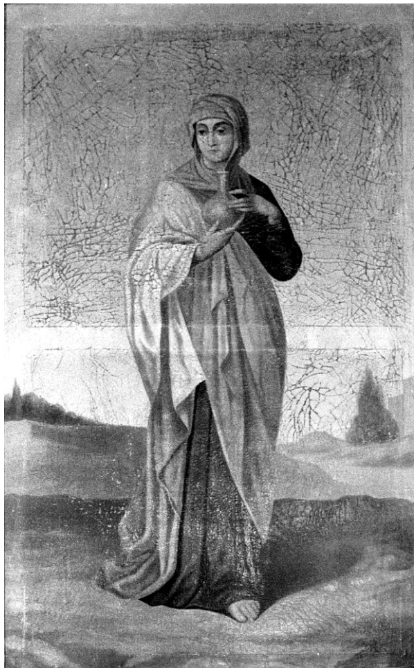
(Рис.7) Мария Магдалина. Конец XIX-начало XX в.