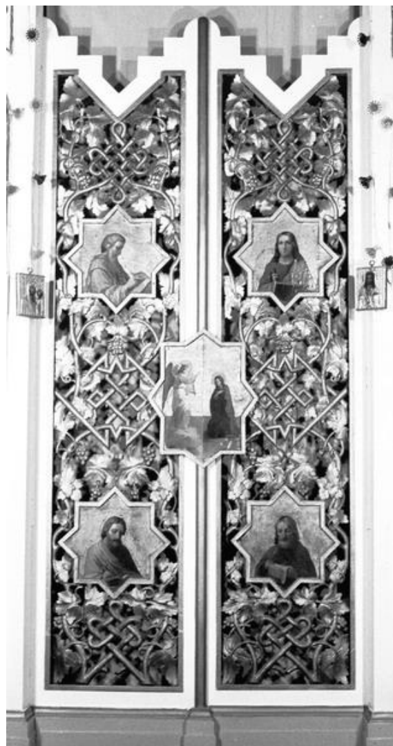
(Рис. 2) Царские врата. Конец XIX – начало XX в.