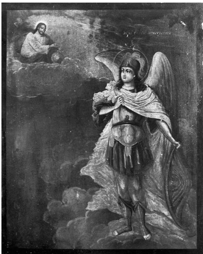
(Рис.1) "Архангел Михаил". Нач. XX века