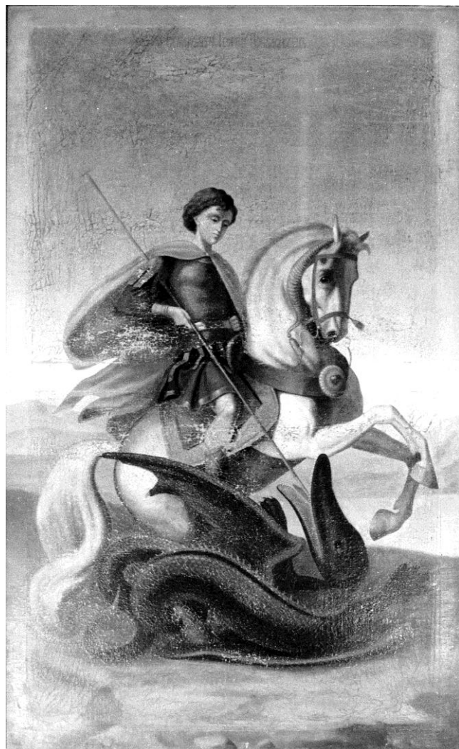
(Рис.8) Чудо Георгия о змие. Конец XIX-начало XX в.