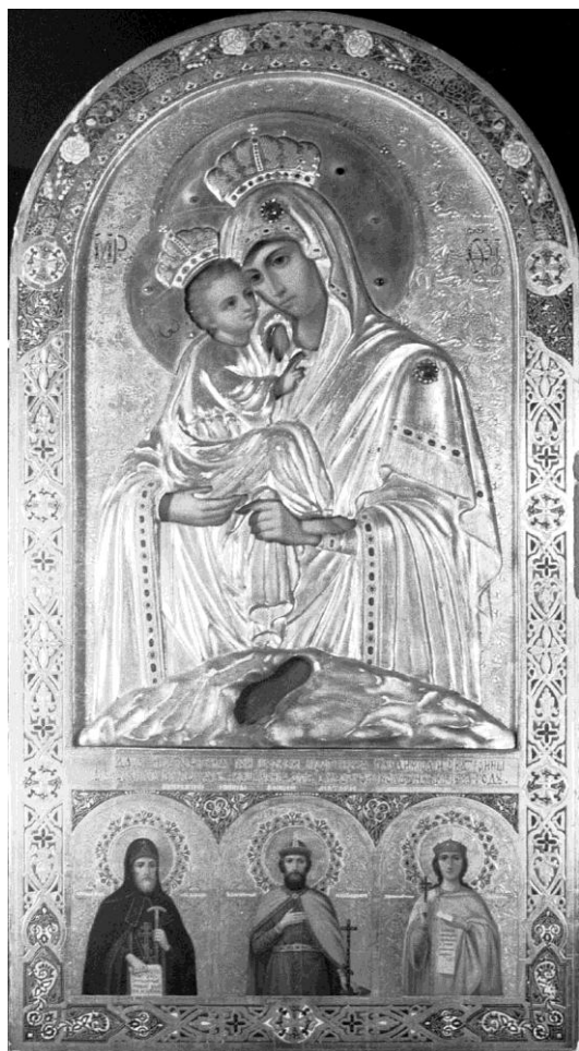
(Рис. 4) Богоматерь Почаевская Конец XIX-начало XX в.