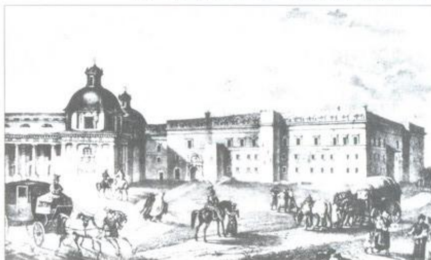
2. Гаспадарскі палац, выгляд на канец XVIII ст. Літаграфія Рачынскага, 1832.