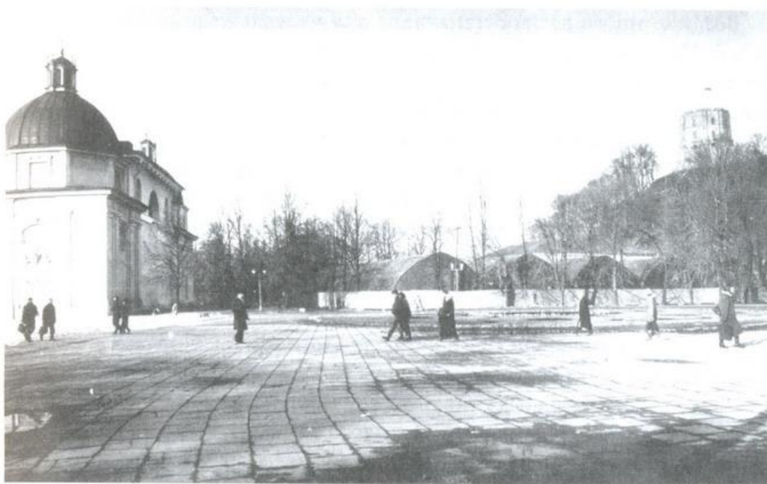
4. Павільён над раскопам палаца.