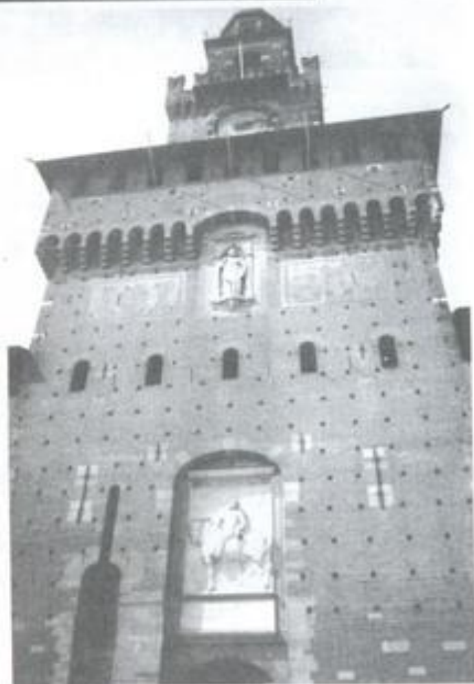
6. Замак Сфарцэска. Мілан. Сярэдзіна XIV ст.