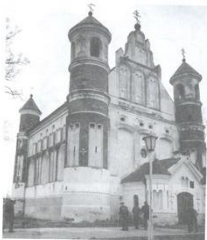
3-4. Царква Раства Багародзіцы ў Муравіянцы. XVI ст.