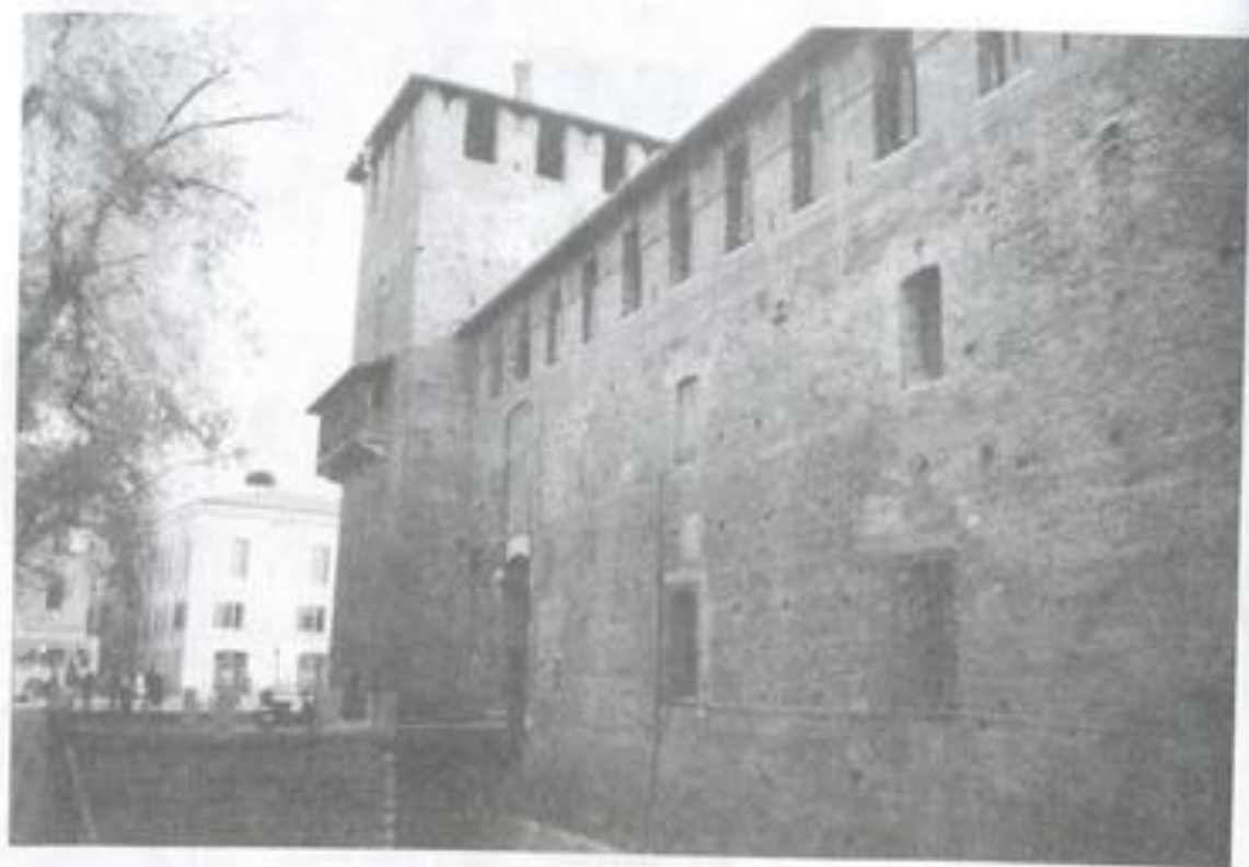
7-8. Замак Сфарцэска. Мілан, Сярэдзіна XIV ст.