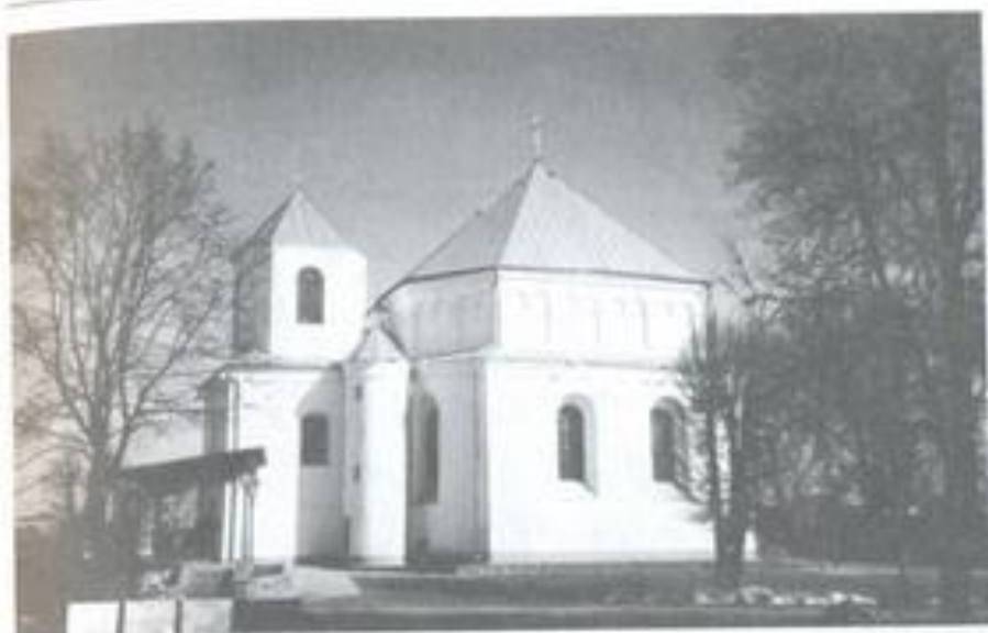
5. Кальвінскі збор у Смаргоні, XVI-XVII стст.