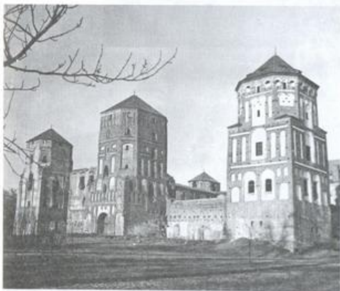
2. Мірскі замак. XV–XX стст.