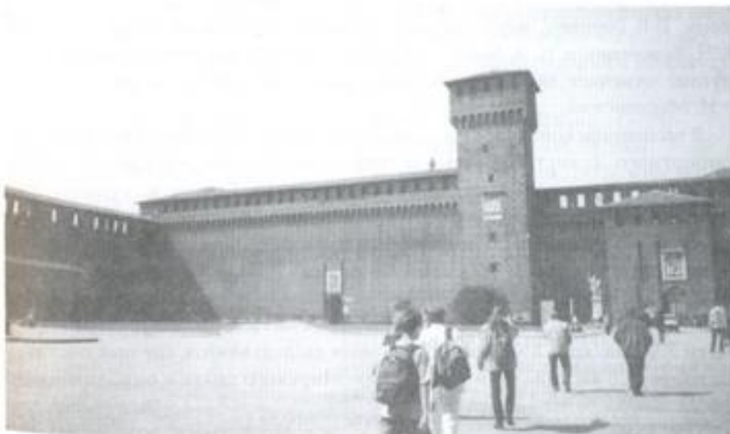
9-10. Замак Сфарцэска. Мілан. Сярэдзіна XIV ст.