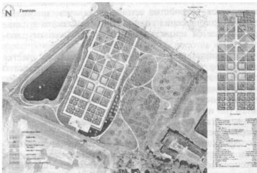
Реконструкция регулярного парка. Генплан